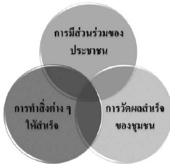
แผนชุมชนที่มีพลัง